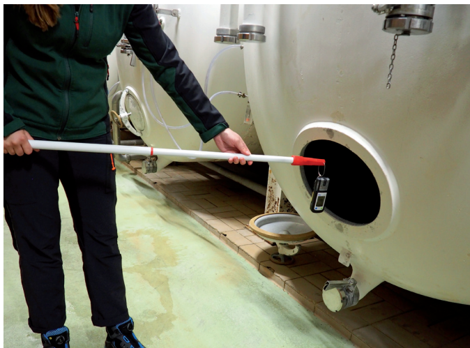
Abb. 8: Freimessen eines Lagertanks vor dem Einsteigen. Mit Hilfe einer Teleskopstange kann mit dem Messgerät im Behälterinneren die \text{CO}_2 -Konzentration bestimmt werden.