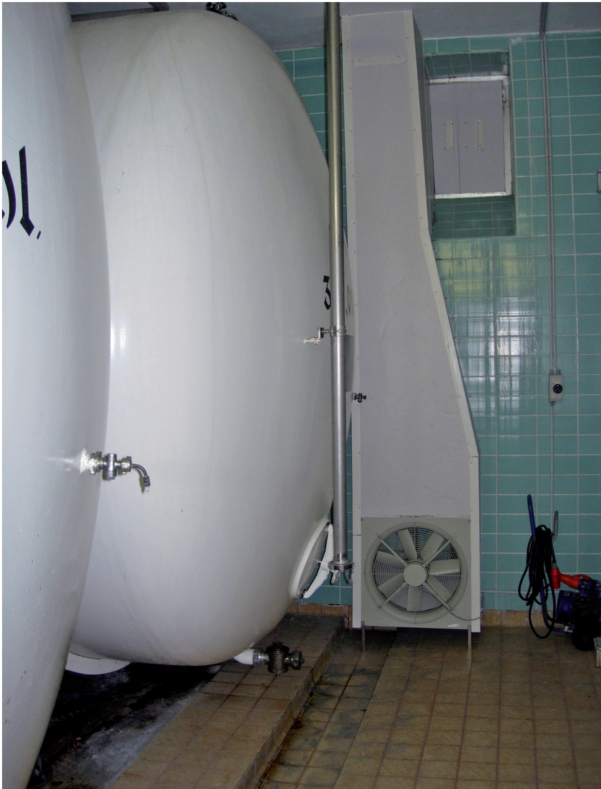
Abb. 6: Beispiel für eine Absaugung der Raumluft in einem Lagerkeller