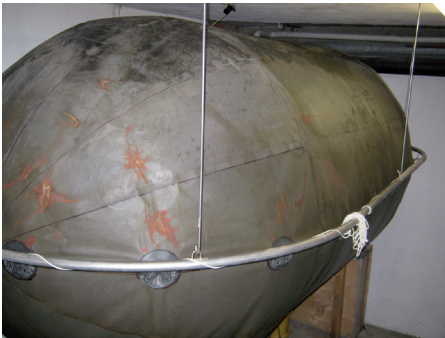
Abb. 4: Sammelballon für CO 2

So können im Aufstellungsraum der CO 2 -Rückgewinnungsanlage bei einer Leckage große CO 2 -Mengen freigesetzt werden, z. B. aus einem Sammelballon oder einem Verdichter.