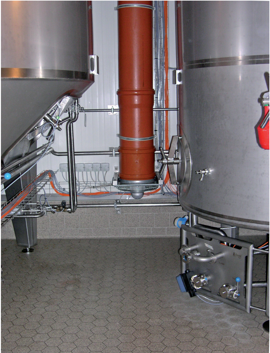
Abb. 5: Beispiel für eine Absaugung der Raumluft in einem Gärkeller