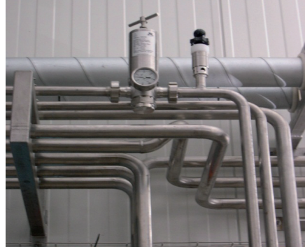
Abb. 3: \text{CO}_2 -Leitung mit Druckminder- und Sicherheitsventil

Zum Schutz nachgeordneter Behälter vor unzulässig hohen Betriebsüberdrücken beim Leerdrücken oder Vorspannen mit \text{CO}_2