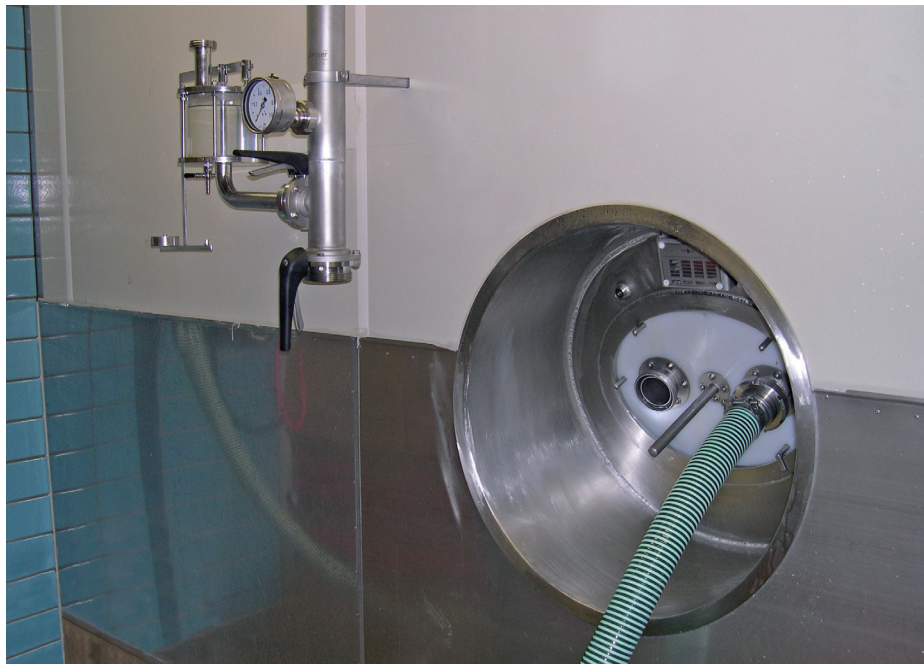
Abb. 7: Beispiel für eine Absaugvorrichtung an einem Lagertank mit Belüftung über Spundapparaturleitung und Mannlochöffnung

Schutzmaßnahmen zu unterweisen. Die Unterweisungen sind mindestens einmal jährlich durchzuführen, zu dokumentieren und durch die Unterschrift der Beschäftigten zu bestätigen.