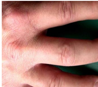
Beginnende Schädigung: präventive Maßnahmen erforderlich