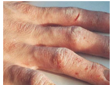
Schwere Schädigung: ärztliche Behandlung erforderlich