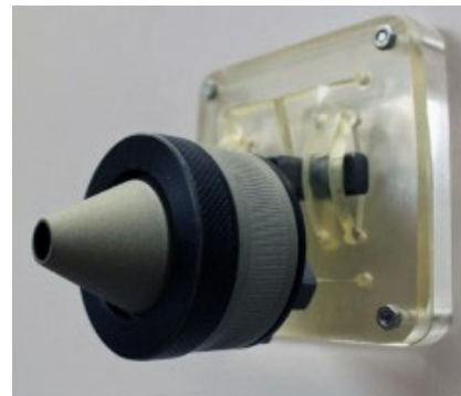
IFA E-Staub https://dguv.de/ifa/fachinfos/arbeitsplatzgrenzwerte/probenahmegeraete/pgp-probenahmekoepfe/index.jsp